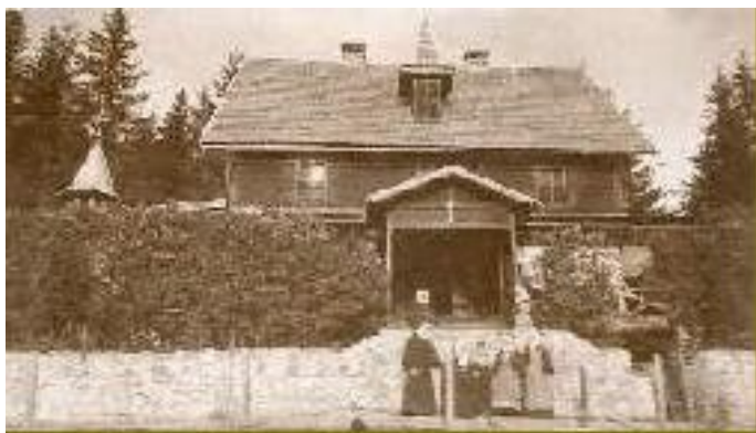
La Maria-domo en Pale