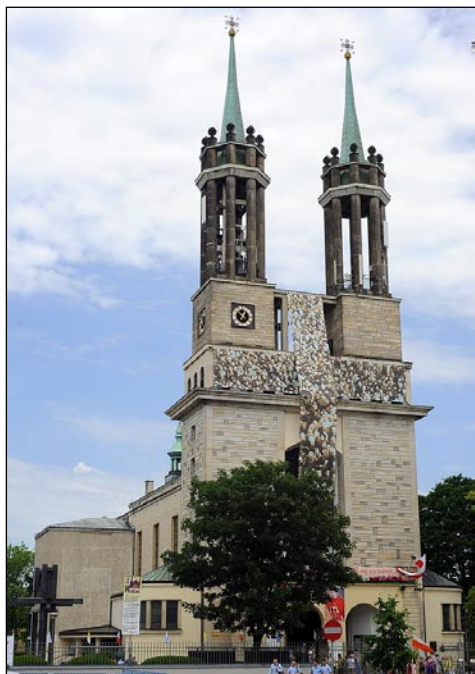
Preĝejo de s-ta Stanislaŭo Kostka en Varsovio

venas hejmen, kiam ilian aŭtomobilon haltigas anoj de komunista sekreta polico. Sed sur si ili havas uniformojn de trafika polico. La ŝoforon ili devigis transdoni ŝlosilojn de la aŭtomobilo kaj eniri ilian aŭtomobilon. Popiełuszko estas katenligita kaj metita en aŭtomobilon valizujon. La ŝoforo dumvoje elsaltis el aŭtomobilo kaj tiel li savis sian vivon. Forkondukantoj haltas rante de arbaro proksime de Toruń, la katenligitan pastron metas teren kaj batas kaj turmentas lin tiel brutale, ke kelkfoje li senkompate eksvenas. Pli forte ili al li kunligas brakojn kaj krurojn, en la buson enmetas buŝŝtopaĵon kaj ĉirkaŭ kolo preparas ŝnuregon. Denove lin enĵetas en aŭtomobilon kaj plu daŭrigas veturon. Kiam ili ekaŭdas el valizujo sonojn, ili