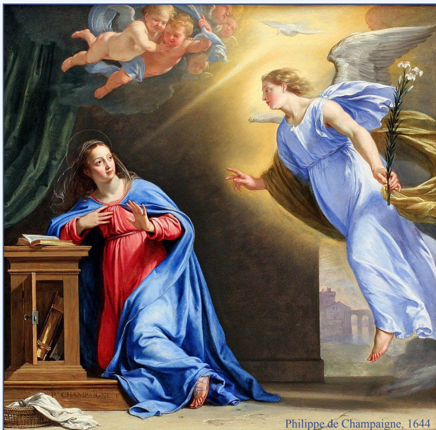
Philippe de Champaigne, 1644

Kaj en la sesa monato la anĝelo Gabriel estis sendita de Dio en urbon de Galileo, nomatan Nazaret, al virgulino fianĉinigita kun viro, kies nomo estis Jozef, el la domo de David; kaj la nomo de la virgulino estis Maria. Kaj li venis al ŝi, kaj diris: “Saluton al vi la grace favorita, la Eternulo estas kun vi.” Sed ŝi tre maltrankviliĝis ĉe tiu diro, kaj konsideris, kia povas esti tiu saluto. Kaj la anĝelo diris al ŝi: “Ne timu, Maria; ĉar vi trovis gracon antaŭ Dio. Kaj jen vi gravediĝos en via ventro kaj naskos filon, kaj vi nomos lin JESUO. Li estos granda, kaj estos nomata Filo de la Plejaltulo; kaj Dio, la Eternulo, donos al li la tronon de lia patro David; kaj li reĝos super la domo de Jakob eterne, kaj lia regno ne havos finon.” Kaj Maria diris al la anĝelo: “Kiel estos tio, ĉar mi ne konas viron?” Kaj la anĝelo responde diris al ŝi: “La Sankta Spirito venos sur vin, kaj la potenco de la Plejaltulo superombros vin; pro kio ankaŭ la naskotaĵo estos nomata sankta, la Filo de Dio. Kaj jen via parenfino Elizabeto ankaŭ gravediĝis je filo en sia maljuneco, kaj la nuna monato estas la sesa por ŝi, kiun oni nomis senfrukta. Ĉar ĉe Dio nenio estas neebla.” Kaj Maria diris: “Jen la sklavino de la Eternulo; estu al mi laŭ via diro.” Kaj la anĝelo foriris de ŝi. Luk 1,26-38