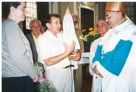
Kardinalo Miloslav Vlk benis la statueton de la Fatima Madono - la donacon de la italaj kongresanoj kaj transdonis ĝin al la Ĉeĥa IKUE-Sekcio

Nu kaj ekestis ĉefa demando, kie en la urbo Olomouc okazigi la kongreson. La pastro IKUE-ano praktikanta la animzorgan servon en la paroĥo de la sankta Mikaelo situanta tuŝapude de la porpastra seminario demandis la tiean rektoron, ĉu estus eble tie okazigi la kongreson de la katolikaj esperantistoj. Li bedaŭrinde ricevis negativan res-