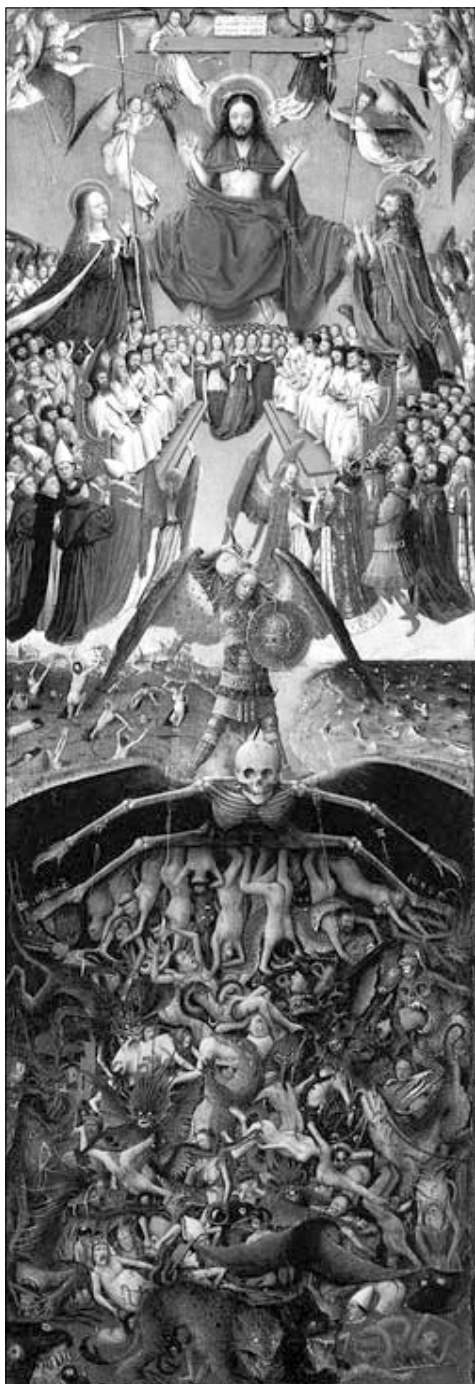
Jan van Eyck, Lasta juĝo, gravuraĵo (1420-1425)

El la Sankta Skribo ni scias, ke en momento de morto „ni ĉiuj devas elmontriĝi antaŭ la tribunala seĝo de Kristo, por ke ĉiu ricevu tion, kion li faris en la korpo, laŭ siaj faritaĵoj, ĉu bonaj aŭ malbonaj“ (2 Kor 5,10). Tiam okazos juĝo: „... estas dekretite por homoj unufoje morti, kaj post tio juĝo.“ (Heb 9,27) Jesuo Kristo montras, el kio ĝi konsistos: „Kaj jen estas la juĝo: ke la lumo venis en la mondon, kaj la homoj amis la mallumon pli ol la lumon, ĉar iliaj faroj estis malbonaj. Ĉar ĉiu, kiu faradas malbonon, malamas la lumon, kaj ne venas al la lumo, por ke liaj faroj ne estu malaprobataj. Sed tiu, kiu faras la veron, venas al la lumo, por ke liaj faroj estu montrataj, ke ili estas faritaj en Dio.“ (Joh 3,19-21)