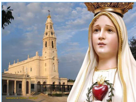
Fatimo - la fama pilgrimloko en Portugalio, kie al Lucia, Jacinta kaj Francisco ekde majo ĝis oktobro 1917 aperadis la Virgolino Maria